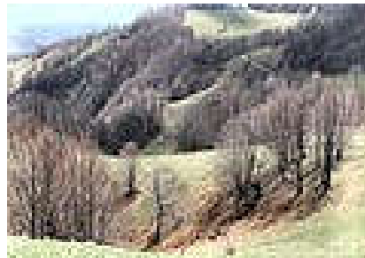
OBRONCI MALOG POVLENA